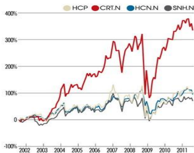
图 1: 养老/医疗地产 REITs 公司的股价走势比较

在丰厚现金流的支撑下，公司连续第 26 年提高每股红利额，使股息收益率维持在 5% 左右。2010 年，HCP 股东的总回报率（分红收益+资本利得）达到 27.5%，过去 5 年（2006-2010 年）的年均回报率为 12.6%，过去 10 年（2001-2010 年）年均总回报率为 16.5%（图 1）。